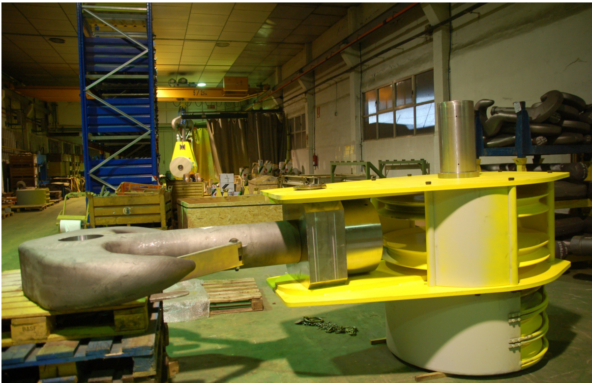
Een belangrijk product van Irizar Forge Ltd. Spanje: een samengesteld hijsblok met gesmede hijszaak

Info: www.formaco.nl en www.irizarforge.com